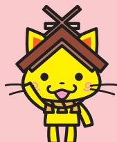
島根県観光キャラクター 「しまねっこ」 島観連許諾第7714号

1981 学校法人PL学園高等学校卒業 1981~2002 川崎製鉄株式会社水島製鉄所(現JFEスチール(株)西日本製鉄所) 同社硬式野球部22年間在籍 2003~現在 岡山県スポーツ協会スポーツ相談室相談員 2007~現在 岡山県スポーツ協会スポーツ医・科学委員 2020~2021厚生労働省「高齢労働者安全衛生対策実証等事業検討員」 2023 岡山県+SAFEコンソーシアム協議会アドバイザー(岡山労働局) 2023~ 岡山県産業保健相談員 会員所属:日本産業衛生学会・日本臨床スポーツ医学会・日本転倒予防学会・軽 労化研究会・FTEX