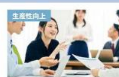
チームの生産性が2倍！！最高品質の会 議術～生産性の向上は会議で9割決ま る～