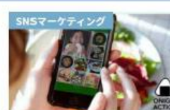
【ファンの心を掴む】実例から学ぶ最 先端のソーシャル・マーケティング機 略