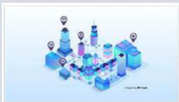
今日から始めるデジタル トランスフォーメーション