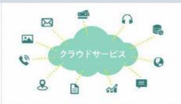
ミニアニメで解説！やさしい 『DX・IT用語』入門