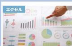
【初心者から上級者まで】1日で学べ るエクセルの教科書 マスターコース