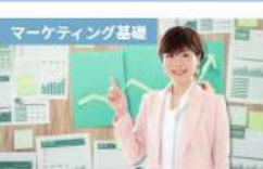
【これでOK!】あらゆるビジネス に役立つ！はじめての実践マーケテ ィング講座