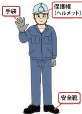
作業者に身につけてほしい望ましい装備例