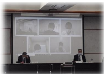
オンライン参加の状況