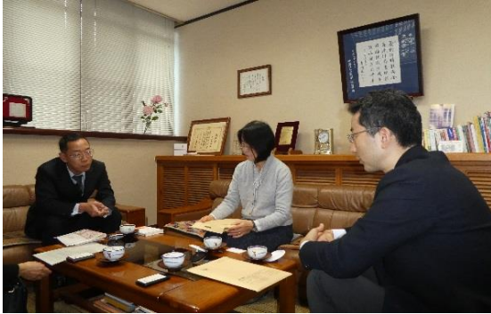
↑ 11/30 中村ブレイス株式会社を訪問