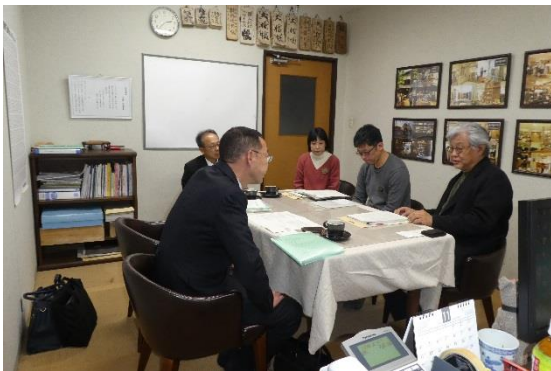
↑ 11/30 株式会社石見銀山生活文化研究所を訪問