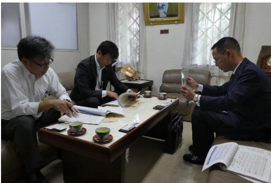
↑ 10/10 株式会社 島根ワイナリーを訪問