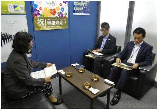
↑ 9/18 ALSOK あさひ播磨株式会社を訪問