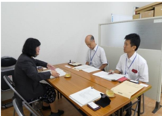
↑ 9/18 株式会社服部タイヨーを訪問