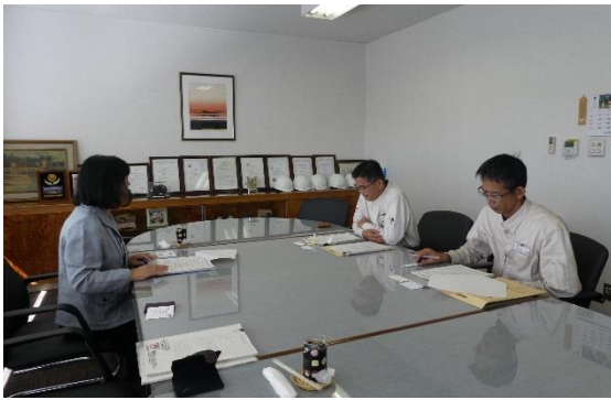
↑ 9/27 ヤンマーキャステクノ株式会社を訪問