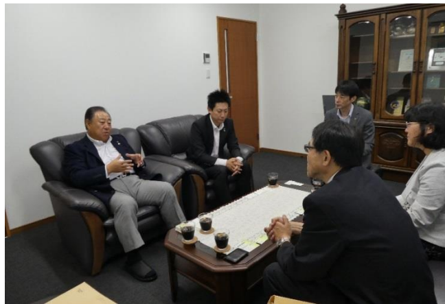
↑7/27 企業警備保障株式会社を訪問