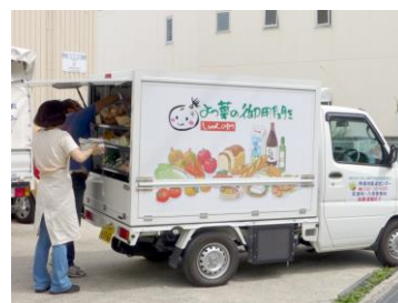
移動販売車“旬の助”

○安全・安心な食べものをご家庭にお届けする関西よつ葉連絡会のメンバーが多数で、互いに協同して活動を支え合う仲間です。