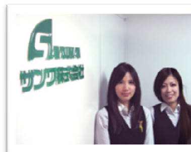
納得のいく転職をバックアップ！