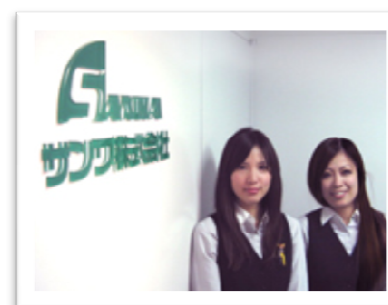
納得のいく転職をバックアップ！