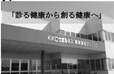
「診る健康から創る健康へ」

KKC ウェルネス栗東健診クリニック 平成27年8月より保険診療スタートいたしました！！