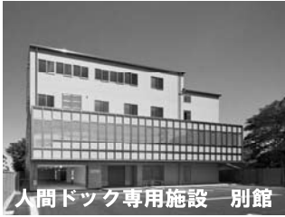
人間ドック専用施設 別館

産業労働者・学童・地域住民への各種健康診断、作業環境測定、健康づくり事業、人間ドック等の実施 総合健康管理機関