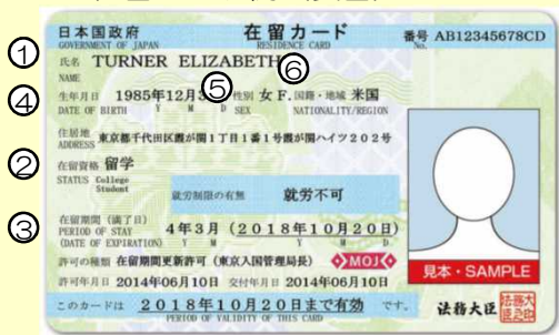
在留カード例（表面）