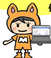
ハローワーク彦根 オリジナルキャラクター MYちゃん