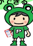
ハローワーク彦根 オリジナルキャラクター ペジタちゃん