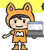
ハローワーク彦根 オリジナルキャラクター MYちゃん