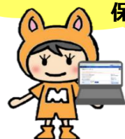
ハローワーク彦根 オリジナルキャラクター MYちゃん