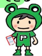
ハローワーク彦根 オリジナルキャラクター ペジタちゃん