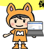
ハローワーク彦根 オリジナルキャラクター MYちゃん