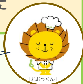
LEOC 公式キャラクター

「食を通じてお客様に喜びと感動をお届けしたい」LEOCは そのような想いをもって全国約3,000ヶ所以上に 幅広く食事を提供する給食委託会社です。