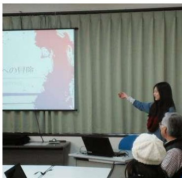
【クラス風景】 訓練後半のプレゼンテーション実習

湖南ネットしがは、シニアのIT力を活かして、地域の情報化を支援し、みんなが生き生きと元気な社会の実現に貢献します。