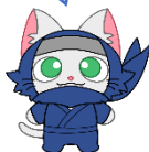
にやすけ (ハローワーク甲賀 公式キャラクター)

ハローワーク甲賀（甲賀公共職業安定所） 〒528-0031 甲賀市水口町本町3丁目1-16 TEL：0748-62-0651