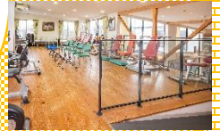
リハビリサポート ゆうらいふ