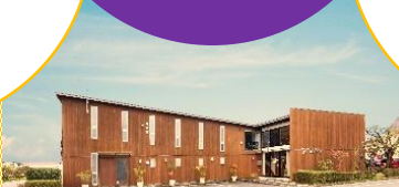
施設所在地 ：守山市