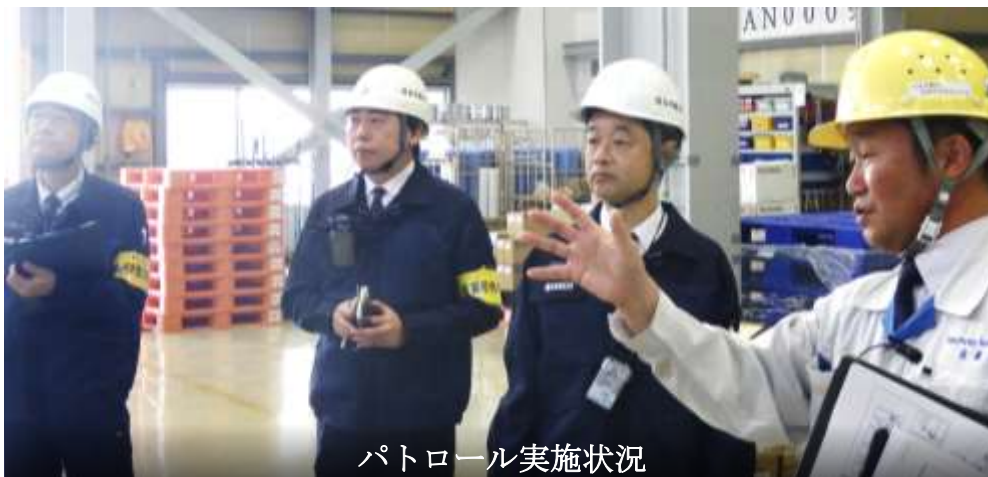
パトロール実施状況