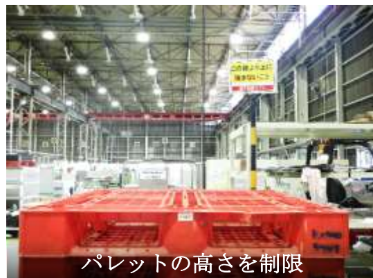
パレットの高さを制限