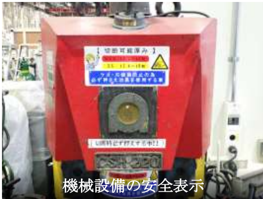
機械設備の安全表示