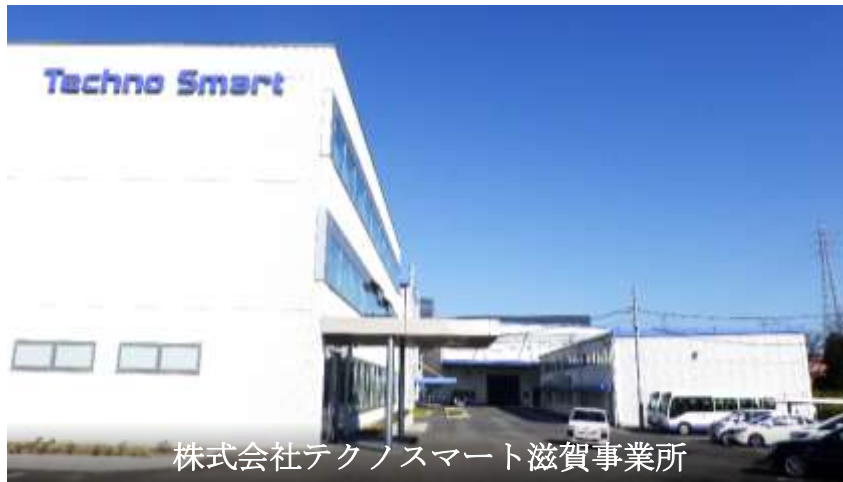
株式会社テクノスマート滋賀事業所

株式会社テクノスマートは、産業用機械設備メーカーであり、滋賀事業所では、各種塗工乾燥装置の開発・設計・製造を行っています。