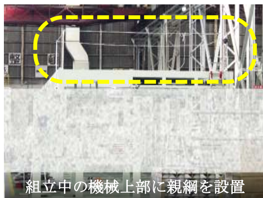
組立中の機械上部に親綱を設置

パトロール終了後、大津労働基準監督署長、滋賀労働局労働基準部健康安全課長から、それぞれ講評が行われ、今後の課題として、脚立の安全な使用方法を検討し、確立していただきたいこと、作業者の危険感受性を意識して各種安全衛生活動を展開いただきたいことをお願いし、パトロールを閉会いたしました。