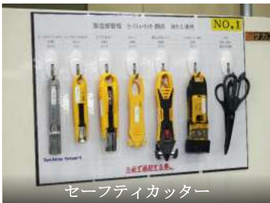
セーフティカッター