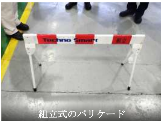
組立式のバリケード