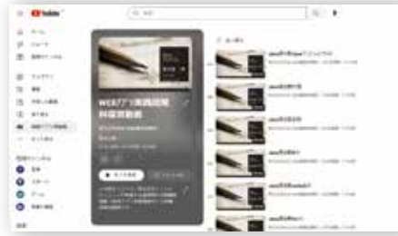
【動画の内容】 訓練内容の要約説明 【復習動画配信期間】 開始:各科目終了後 終了:訓練終了日

また訓練終盤では、実務1年生レベルを想定した模擬開発演習を行います。【DX推進スキル標準対応】