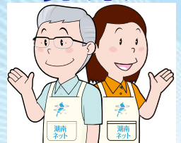
経験豊かな私たちが応援します