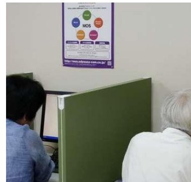
【MOS受験風景】 世界に通じる国際資格