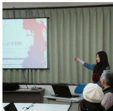
【クラス風景】 訓練後半のプレゼンテーション実習

湖南ネットしがは、シニアのIT力を活かして、地域の情報化を支援し、みんなが生き生きと元気な社会の実現に貢献します。