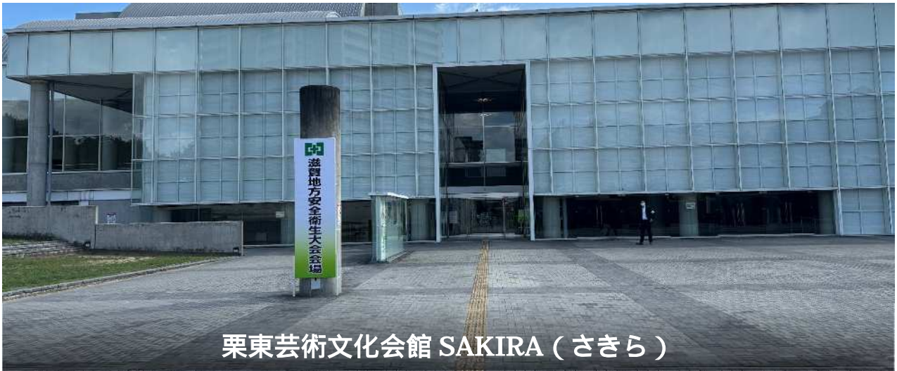
栗東芸術文化会館 SAKIRA (さきら)

「滋賀地方安全衛生大会」は、滋賀県内で最大の産業安全、労働衛生関係の催しで、県内の各事業場等からは467名が参加する大会となりました。