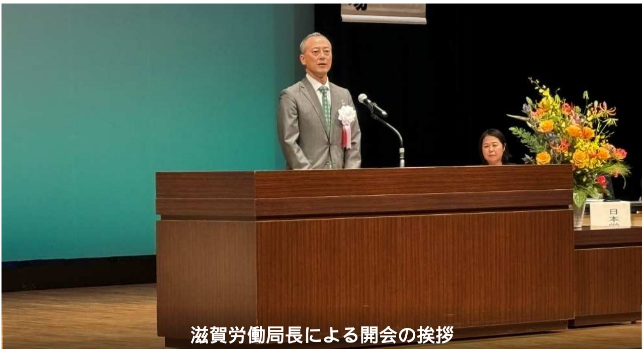
滋賀労働局長による開会の挨拶

主催者を代表し、公益社団法人滋賀労働基準協会長による開会の挨拶、主唱者である滋賀労働局長による開会の挨拶に引き続き、来賓としてお迎えした、滋賀県副知事、日本労働組合総連合会滋賀県連合会長、一般社団法人滋賀経済産業協会専務理事が、それぞれ祝辞を述べられました。