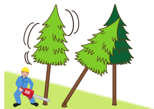
(図4)かかり木に激突させるためにかかり木以外の立木の伐倒