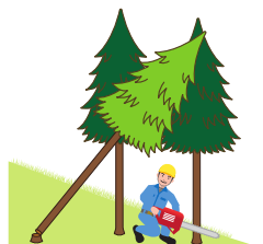
(図3)かかっている立木の伐倒