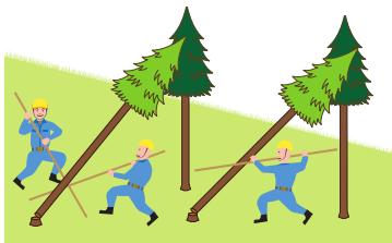
(図2)かかり木の処理

<注意> 「かかっている木の元玉切り」(かかった状態のまま元玉切りをし、地面等に落下させることにより、かかり木を外すこと。)(図5)は、今般の改正により禁止されるものではありませんが、かかり木の安全な処理方法とは言えないことに留意してください。