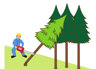
(図5)かかっている木の元玉切り