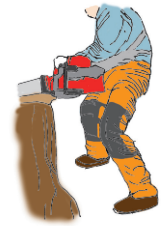
（図7）下肢の切創防止用保護衣

〈注意1〉（図7）で例示した下肢の切創防止用保護衣は、前面にソーチェーンによる損傷を防ぐ保護部材が入っており、JIS T8125-2に適合する防護ズボン又は同等以上の性能を有するものを使用してください。また、労働者の身体に合ったサイズのもを着用してください。既にソーチェーンが当たって繊維が引き出されたものなど、保護性能が低下しているものは使用しないようにしてください。