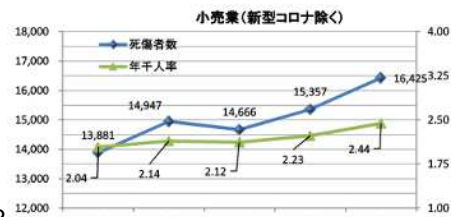
小売業の労働災害発生件数・災害発生率

転倒した時について 手を骨折する など、転倒災害は 重症化しやすく 、一度の転倒で長期間休むリスクがあります。