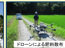
ドローンによる肥料散布