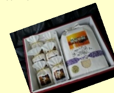
食のプロに認められたお米『琵琶の淡(びわのうみ)』

A:どこよりも美味しい独自の『食味』を追求し続け、試行錯誤を経てこだわり栽培を確立し、私の『理想の米』にたどり着きました。『いつものお米また送って下さい』『毎日美味しさを感じるお米です』と生産者にとってこの上ない嬉しいお声をお客様から頂いている事です。