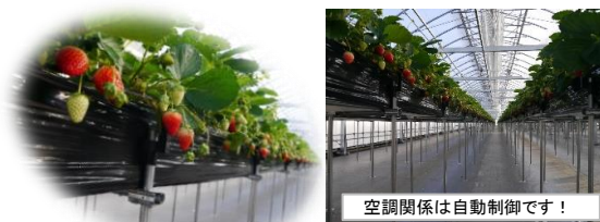
空調関係は自動制御です！