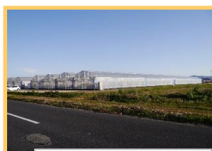
立田地区の栽培ハウス

A：ハウス内の立ち作業中心となりますので、「体力」「やる気」のある方であればどなたでも歓迎します。