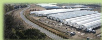
グリーンエコスター農場外観