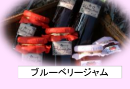
ブルーベリージャム