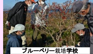
ブルーベリー栽培学校