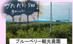
ブルーベリー観光農園