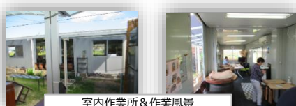
室内作業所&作業風景