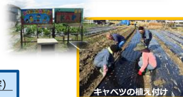
キャベツの植え付け