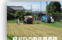
稲刈りの委託業者様