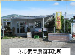
ふじ愛菜農園事務所