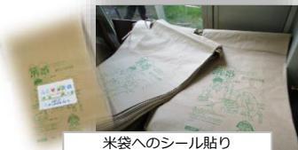
米袋へのシール貼り