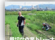
親切な作業トレーナー