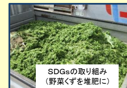
SDGsの取り組み (野菜くずを堆肥に)