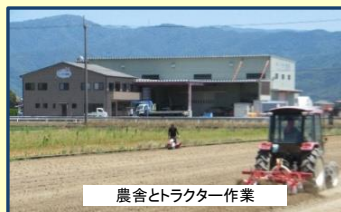
農舎とトラクター作業