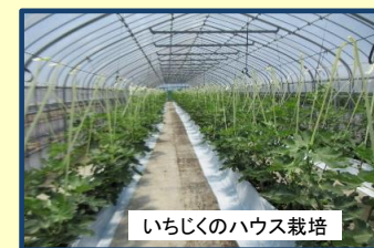
いちじくのハウス栽培