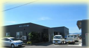
株式会社グリーンパワー長浜