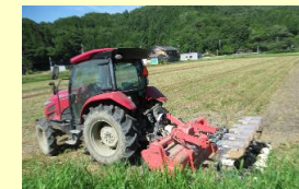
トラクターによる大豆の播種

A:氷河期世代の紹介は、滋賀県農業法人協会からも頻りに紹介が来ており、就業体験含めて受入の問題はありません。「アルバイトが良い」「社員までは考えない」という方もおられましたがあくまで本人次第、「社員どうですか？」という強制はしていません。