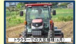
トラクターでの大豆播種(6月)