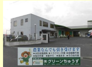
株式会社グリーンちゅうずの外観