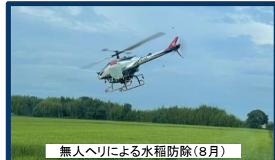
無人ヘリによる水稲防除(8月)