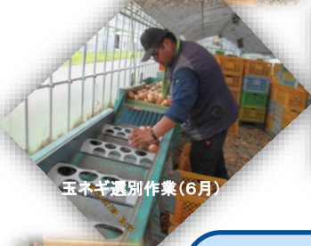
玉ネギ選別作業(6月)