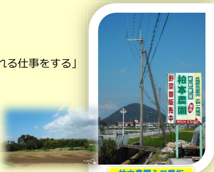
柏本農園入口看板