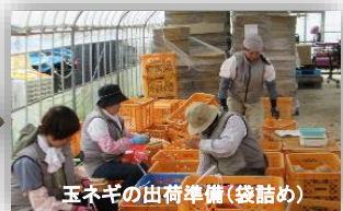
玉ネギの出荷準備(袋詰め)