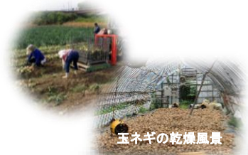
玉ネギの乾燥風景

水稻、野菜苗、野菜の栽培から流通まで1年を通して行っています。力仕事は男性のイメージですが、弊社では女性の方が多く活躍していただける職場です。