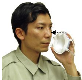
接顔クッションの切れ込み

しめひもを手の甲側に回し、マスクの内側の接顔クッションの切れ込みのある部分を鼻根に当てるようにつけます。