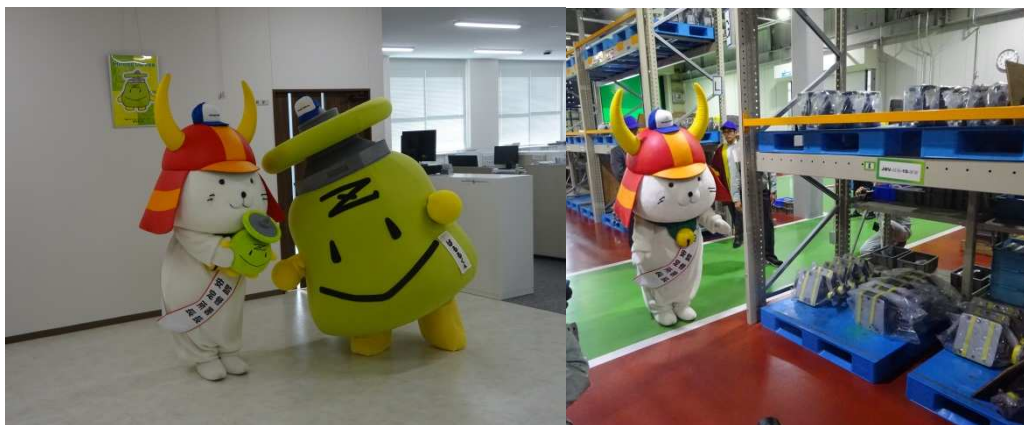
ひこにゃんも「1日監督署長」として同行しました。

ヒロセ活性化委員会(ヒロ活)、会長・社長による社内パトロールや昼食会議(毎日)など