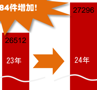
首都圏4労働局における労働災害発生件数