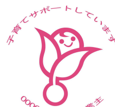
認定マーク「くるみん」