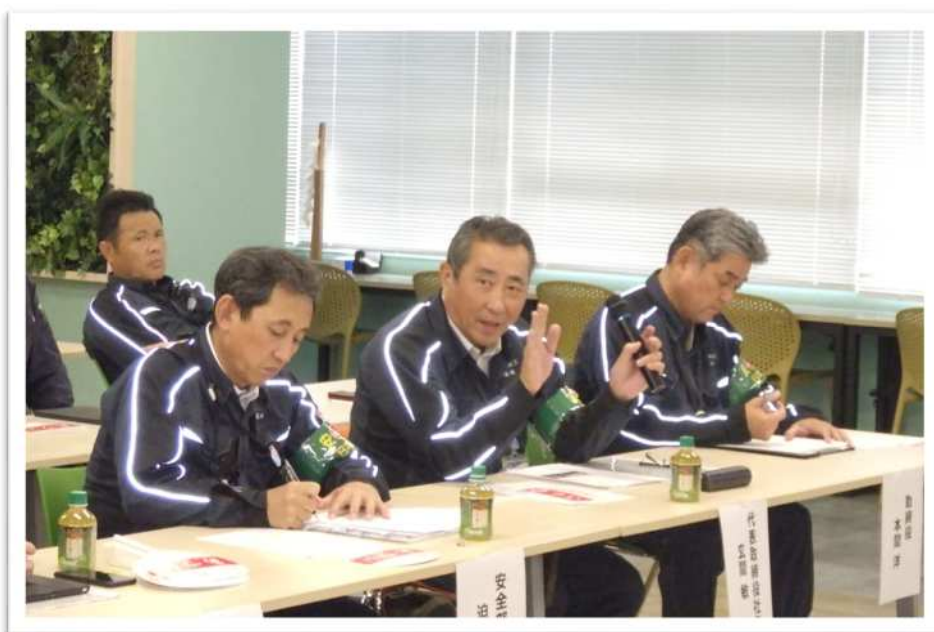
報道関係者の質問に回答 する玄間社長