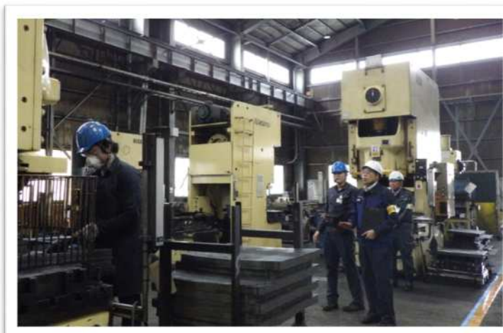
プレス作業の状況を確認する片淵局長