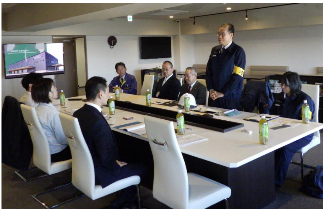
パトロール結果を講評する片淵労働局長