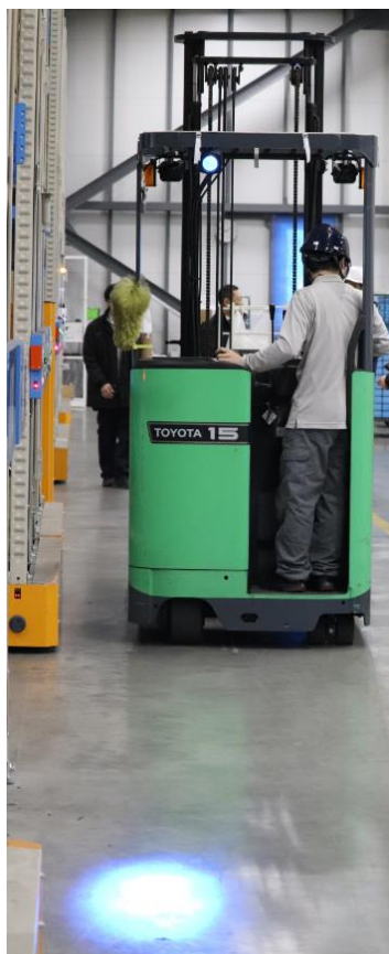
フォークリフトの後進を知らせるブルーライト