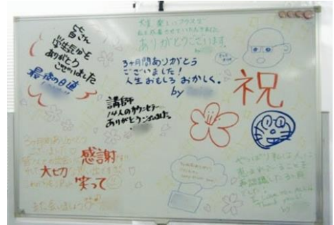
（修了受講生の寄せ書き）