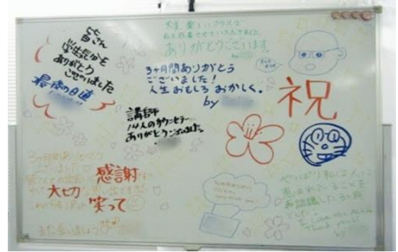
（修了受講生の寄せ書き）