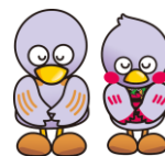
埼玉県マスコット 「コバトン」「さいたまっちゃん」