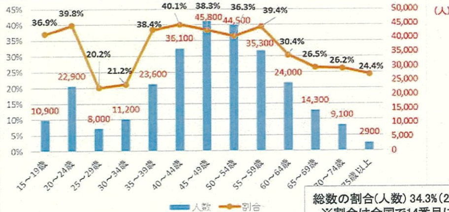
非正規で働く女性のうち就業調整をしている女性の人数・割合(年齢階級別)【埼玉県】