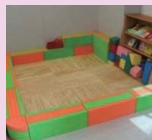
キッズコーナーの例