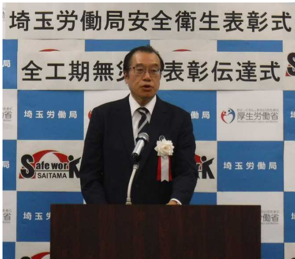
(埼玉労働局長の祝辞)