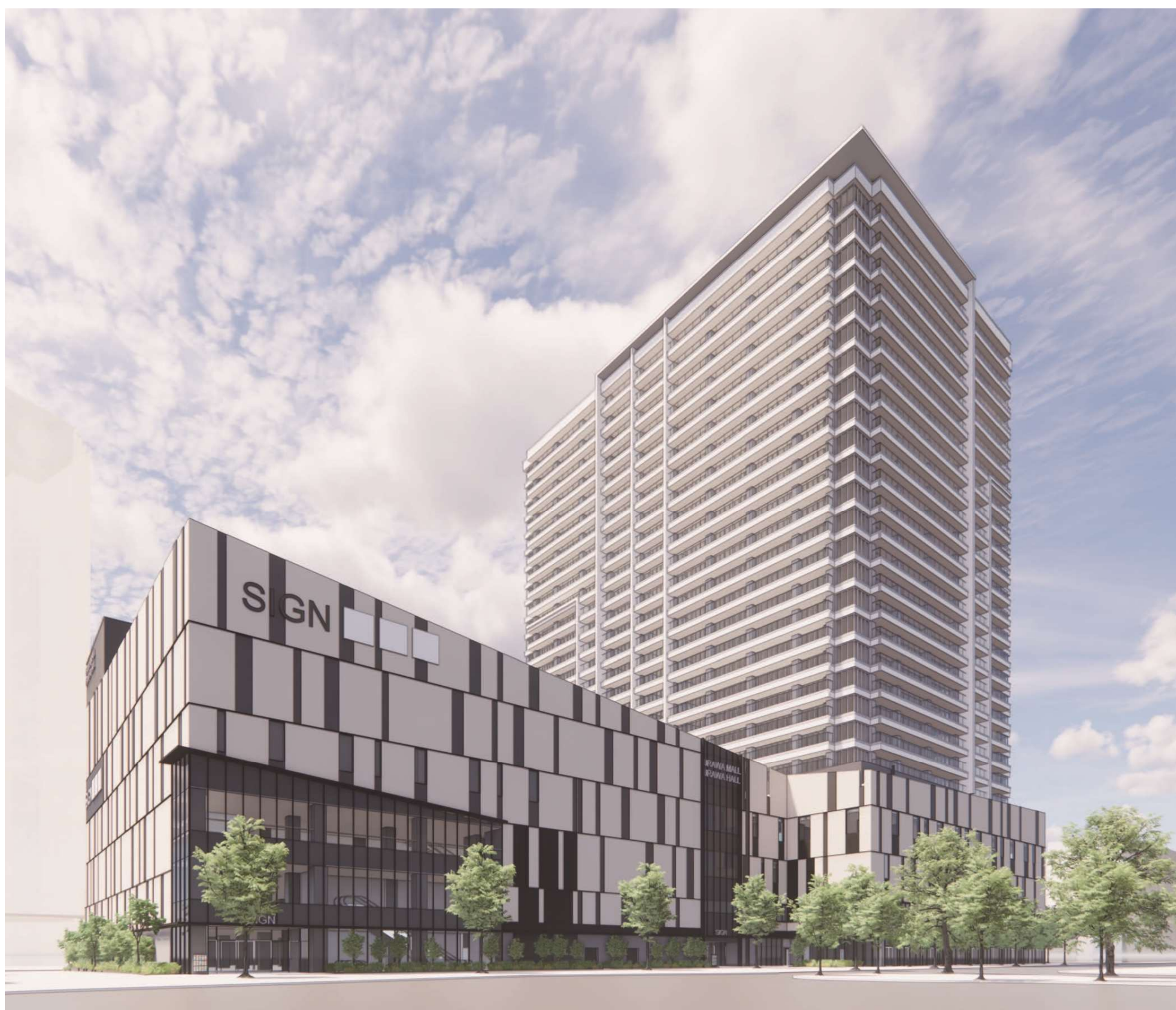
JR浦和駅西口から見た完成予想パース