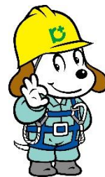
建設業労働災害防止協会PRキャラの「ホビー君」もフルハーネスを着用!